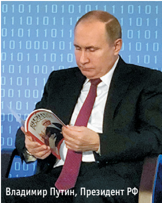
Владимир Путин, Президент РФ