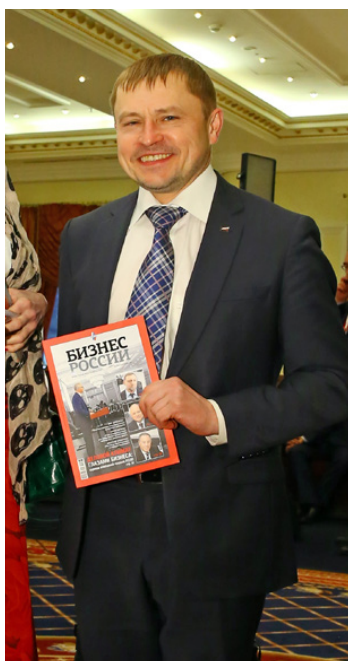
Александр Калинин, президент «Опоры России»