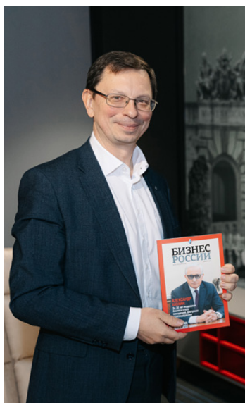
Никита Анисимов, ректор Высшей школы экономики