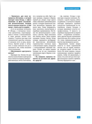
Модуль 1/2 горизонтальный 134x100 мм 300 000 руб.