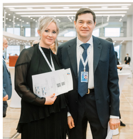
Алексей Мордашов, председатель совета директоров ПАО «Северсталь»