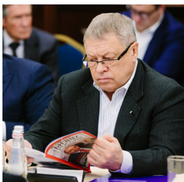
Игорь Зюзин, председатель совета директоров ОАО «Мечел»