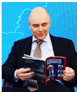
Антон Силуанов, Министр финансов России