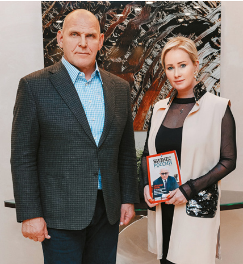
Александр КАРЕЛИН, сенатор Российской Федерации, трёхкратный олимпийский чемпион (греко-римская борьба), Герой Российской Федерации