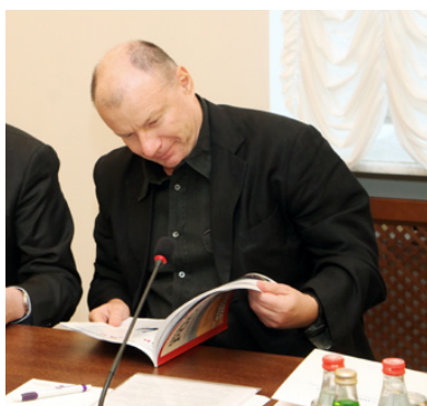
Владимир Потанин, президент – председатель Правления ПАО «ГМК "Норильский никель"»