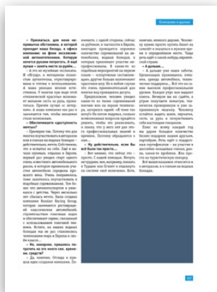
Модуль 1/4 горизонтальный 88,2x76 мм 150 000 руб.