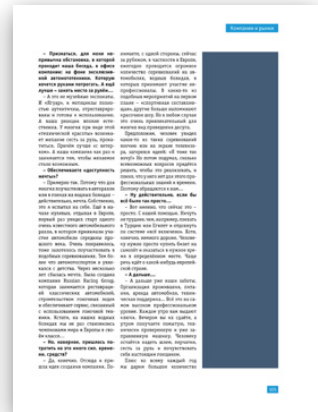
Модуль 1/3 вертикальный 42,4x198,3 мм 200 000 руб.