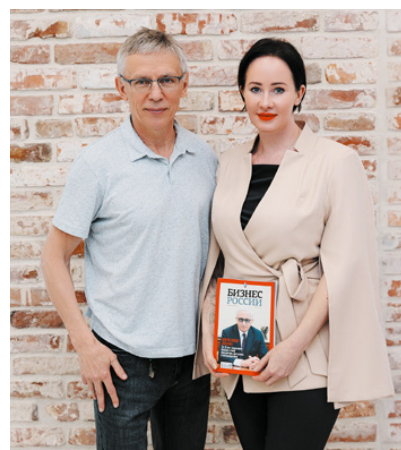
Игорь Ларионов, советский и российский хоккеист, главный тренер ХК «Торпедо» (Нижний Новгород)