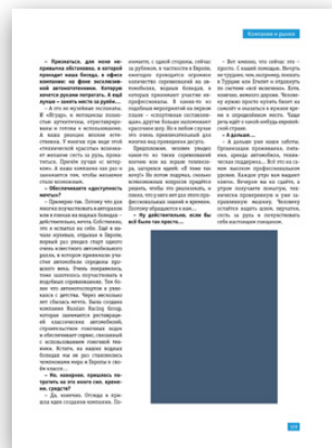
Модуль 1/4 вертикальный 67x100 мм 150 000 руб.