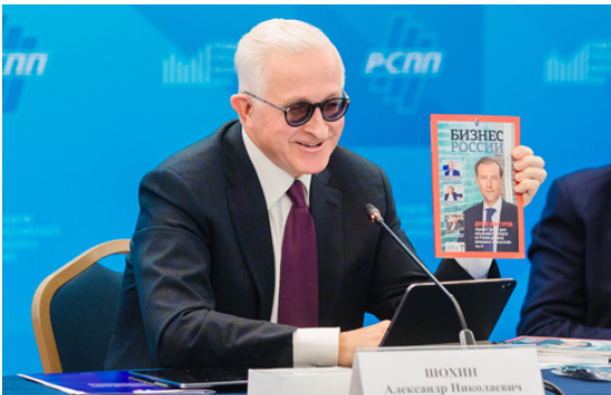
Александр Шохин, президент РСПП