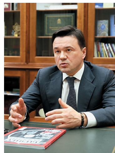
Андрей Воробьёв, губернатор Московской области