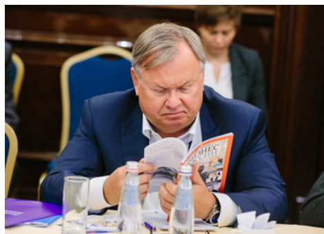
Андрей Костин, президент – председатель Правления ВТБ