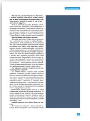
Модуль 1/2 вертикальный 67x198,3 мм 300 000 руб.