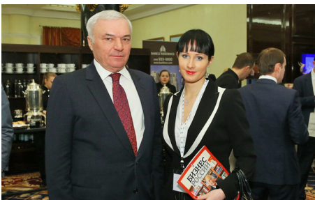
Виктор Рашников, председатель совета директоров ПАО «ММК»