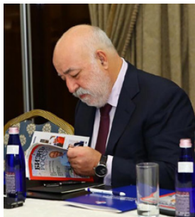
Виктор Вексельберг, председатель совета директоров группы компаний «Ренова»

Члены Бюро Правления РСПП, члены Правления РСПП, руководители региональных отделений РСПП.