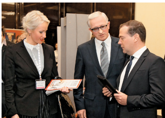
Александр Шохин, президент РСПП, Дмитрий Медведев, заместитель Председателя Совета Безопасности РФ (до 15.01.2020 г. – Председатель Правительства РФ)