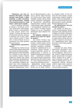
Модуль 1/3 горизонтальный 134x64 мм 200 000 руб.