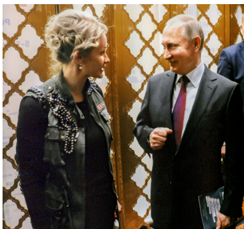
Владимир Путин, Президент РФ